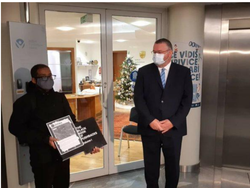
Info Kolpa, miembro de la red, presenta el libro al Defensor del Pueblo de Eslovenia